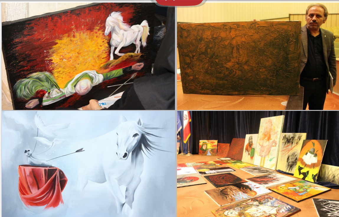
آثار هنری کارگاه نقاشی زخم بر بوم